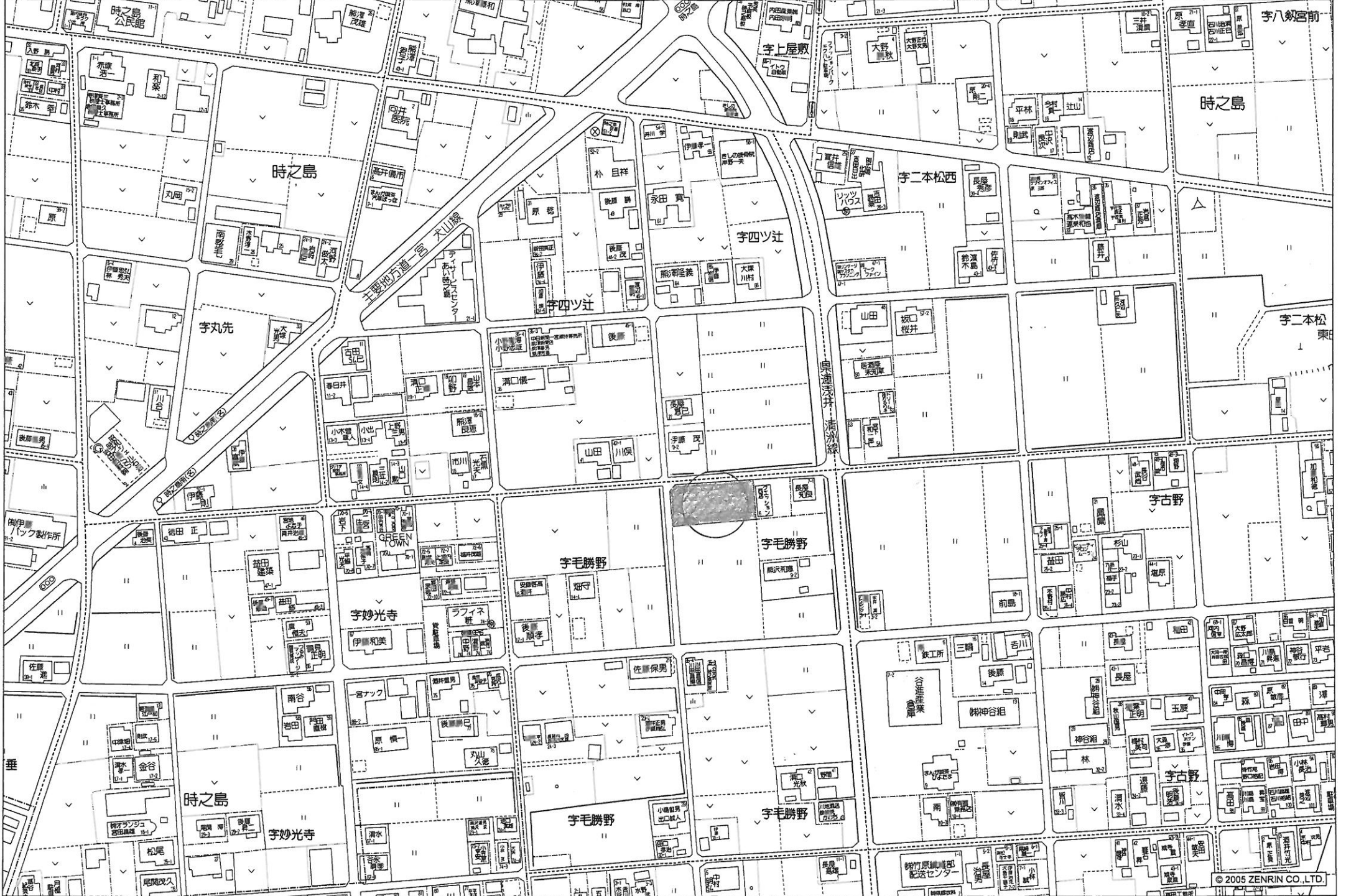
一宮市時之島宇四ツ辻付近